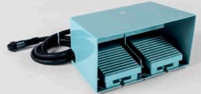
Педаль (установка только на фабрике)