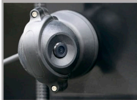
Камера - стандартная опция