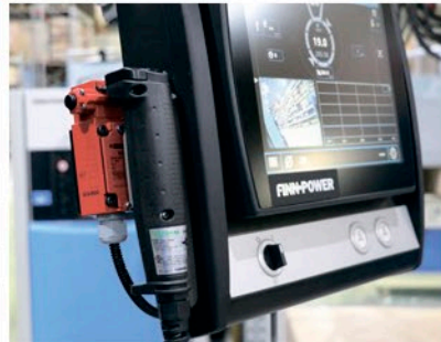
Пульт дистанционного управления